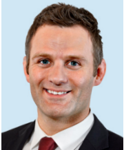
Ole Bischof Vizepräsident Leistungssport Deutscher Olympischer Sportbund